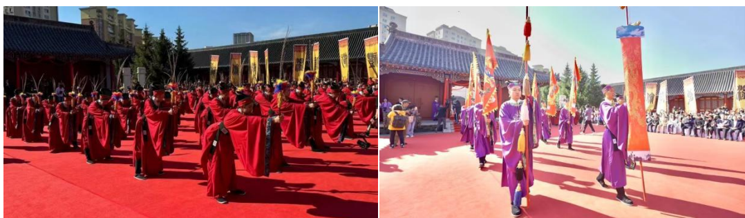
图4-2：学生文庙实践活动

参天大树，必有其根；怀山之水，必有其源。我校将以此活动为契机，坚持立德树人、五育并举，让更多学子在传统文化的滋养下茁壮成长，将中华民族的优秀传统文化一代一代传下去，为全面推进强国建设、民族复兴伟业注入强大的精神动力！