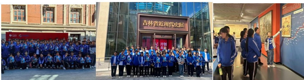
图4-3：学生思政参观实践活动

呈现了一堂别开生面的户外思政课。同学们认真聆听讲解，驻足观察、交流感悟，在触摸历史脉络、感受街区底蕴的同时，深化了对思政知识的理解，让学习既有深度又有温度。“思”之有悟，“行”之有路。本次“行走的思政课堂”为同学们搭建了触摸历史，感悟精神的实践平台，通过文化育人，不仅让课本中的思政知识变得可感可触，更让同学们真切地感受到长春这座城市发展中的多民族交融历程。