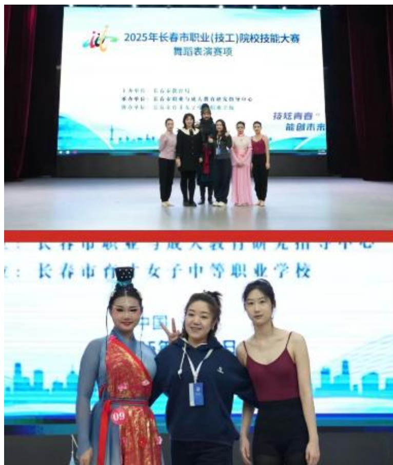
图2-10 “2025年长春市职业院校技能大赛”舞蹈表演赛项