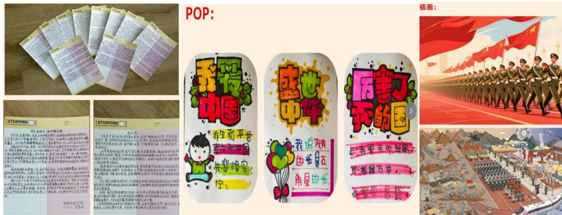
图 2-3 “九三阅兵、强国有我”主题思政活动开展

幕前的凝神，到笔尖下的思考，把“看阅兵”变成“照自己”，开始想“我该怎么让自己变强，怎么为祖国贡献自己的力量”，从这份“感动”到“行动”的蜕变，正式我校思政教育成果的体现。