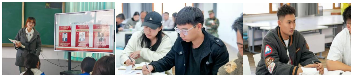
图 2-1 思政课程《同课异构实践活动+》小组研学

学校全面推动习近平新时代中国特色社会主义思想“实践活动+”进课堂，在坚定信念、厚植爱国主义情怀、加强品德修养、增长知识见识、培养奋斗精神、增强综合素质上下功夫；学校在育人体系、专业建设、人才培养模式、社会服务、学校管理等方面，坚持以立德为根本；树人为核心，贯彻“三全三美，五育并举”教育理念，逐步形成“一校一品”美育特色育人校。通过“同课异构”模式开展常识性学习，紧密结合社会实践和学生实际，积极培育学生的核心素养，围绕社会主义核心价值观，立足中职学生的成长成才，充分利用各种节日教育契机，开展爱国主义教育和革命传统教育；将思政教育贯穿于培养全过程，不断加强对社会主义核心价值观的教育和引导，让社会主义核心价值观充实学生头脑，促进学生更好发展。