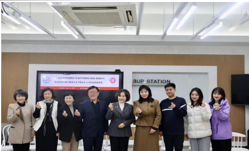
图5-1 与韩国大学研学合作