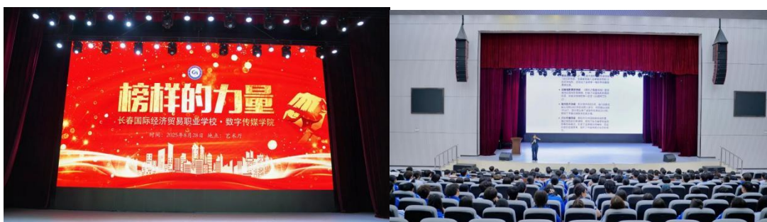
图1-1 开学第一课——榜样的力量

等多种教育教学方式，为入25级新生开展主题清晰、内容丰富、形式多样的入学教育活动。