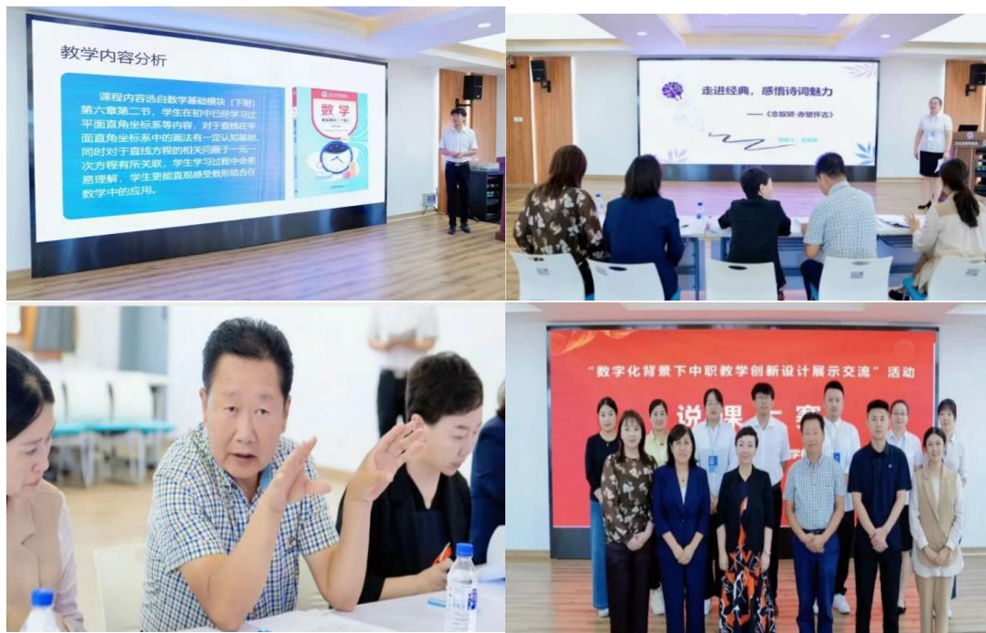
图2-6 “数字化背景下中职教学创新设计展示交流”比赛活动

比拼，共有七位教师脱颖而出，在展示交流环节，七位优秀教师一次围绕教学分析、教学设计、教学实施、教学评价、教学反思等核心维度展开精彩说课。教师们精神饱满、思路清晰，展现出扎实的专业知识和精湛的教学技能，耿传递出对职业教育的热爱与坚守，以及积极拥抱数字化教学变革的进取姿态。