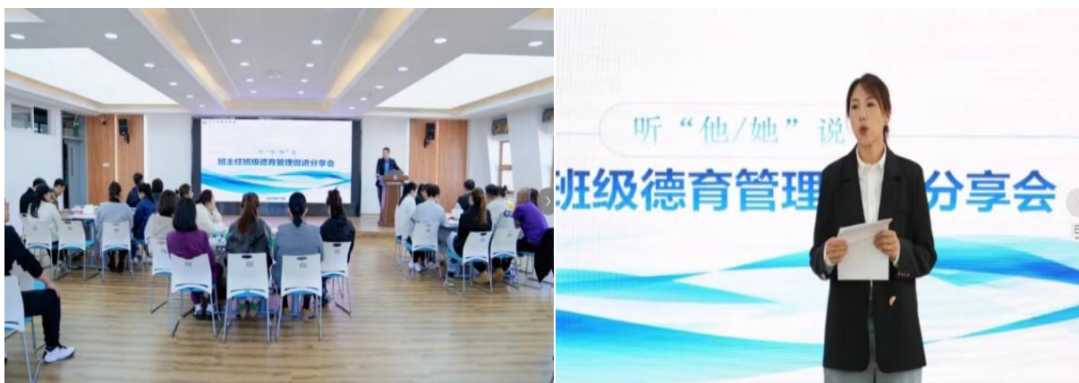
图 2-2 “班主任德育管理交流分享会”活动开展

解决学生急难愁盼问题作为主要任务，做到校院领导干部下沉到一线党支部工作扎根到一线、理论教育开展在一线。以综合培养为导向，将学生发展与“一站式”学生社区工作结合，组织体育节、合唱节、社区运动嘉年华等各类社区活动 30 余项，强化多项活动对学生的包联，围绕学生的思想、思维、专业、生活等特点，创新聚合教育资源，进一步提升职业教育的针对性和实效性。