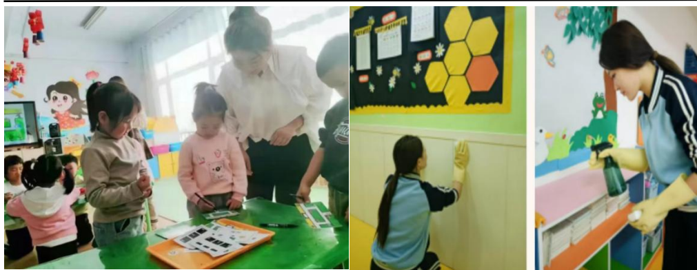
图3-1 我校幼儿保育专业学生在企业实践实习