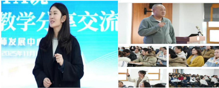
图1-2 “听TA说主题教研”分享交流活动

通过培训进一步提升了教师教育教学能力、科研能力、参赛能力、信息化教学能力，帮助教师保从教初心、守廉洁底线、尊教学制度、促专业发展。