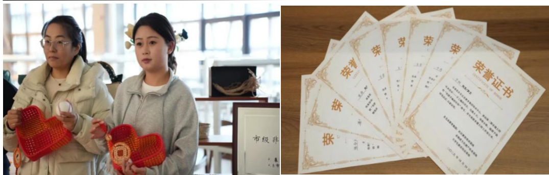
图 3-2 手工编织工艺培训活动