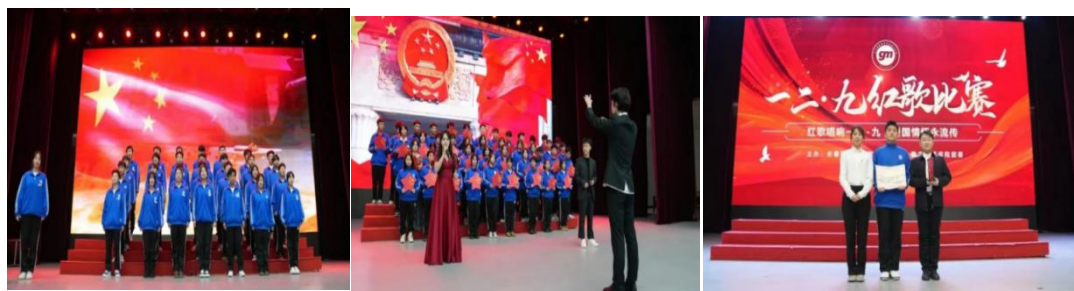
图2-11 “一二九红歌会”比赛活动

为纪念“一二·九”爱国运动，传承红色精神，弘扬爱国主义情怀，12月9日，我校在艺术厅隆重开展了“红歌唱响一二九，传承精神共奋进”校园红歌比赛，表达了对先辈们的深情缅怀和对红色基因的传承接力，对莘莘学子爱国之志的激发和砥砺，此项活动鼓励同学们要铭记历史，胸怀祖国，将爱国热情转化为努力学习、报效国家的实际行动，在新时代的征程中，肩负起民族复兴的伟大使命。以歌铭记历史，以歌唱响未来。在师生合唱中，老师们以身作则，用申请的歌声传递着对祖国的热爱；同学们朝气蓬勃，以激昂的嗓音回应着老师的引领，师生们的声音交织在一起，如同奏响了一曲和谐的交响乐，展现出我校师生团结一心、共抒爱国情怀的动人画面。