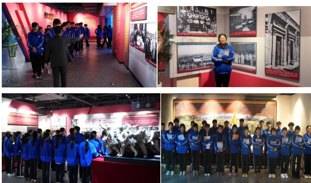
图4-1 传承红色文化——行走的思政课堂

此次走进中国新型政党制度学习实践基地的实践活动，是我校思政教育创新的一次成功尝试。未来，学校将继续搭建更多优质实践平台，引领同学们立足专业、勤学苦练，把社会主义核心价值观内化于心、外化于行、以青春之我、奋斗之我，为国家发展、社会进步贡献育才学子的青春力量！