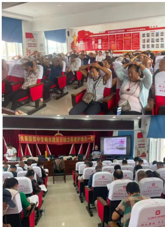
图3-3 脱贫劳动力养老护理员培训