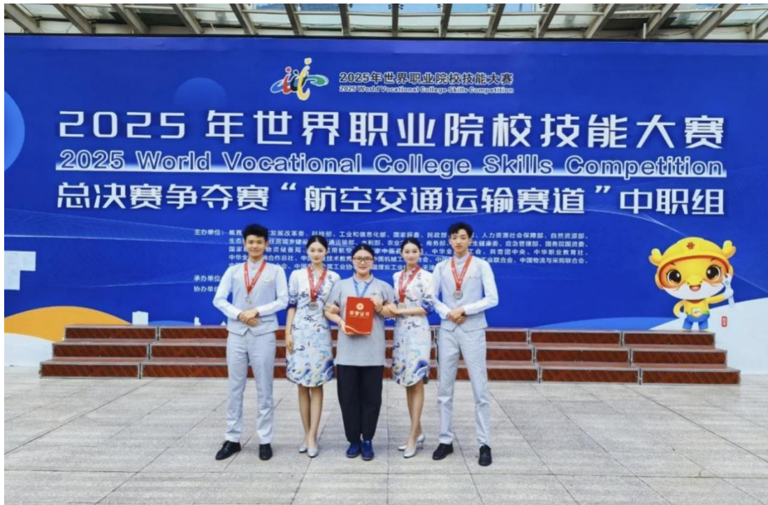
图 2-6：2025 年世界职业院校技能大赛 2