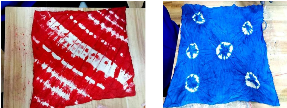
图4-4: 弘扬中国传统文化，探秘绝美扎染技艺

为了弘扬中国传统文化，传承艺术匠心，学校于2023年11月11日，开展了“生活小姿势——探秘绝美扎染技艺”为主题的手工特色课活动。