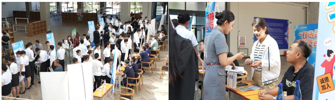
图3-2：学校举办的“双选会”

合自身专业与兴趣，精准定位职业方向，提前体验求职过程，锻炼沟通与应变能力，积累宝贵的职场经验，为日后正式步入社会做好充分准备。对学校来讲，双选会的成功举办彰显了学校的办学实力与社会影响力，加强了学校与企业间的深度合作，有助于学校依据企业需求优化专业设置与课程体系，使教学更贴合实际就业市场，从而提升学校的教育质量与就业指导水平，形成学校、学生、企业三方共赢的良好局面，为学校长远发展注入强劲动力，也为社会培养出更多适应时代需求的专业人才，促进教育与经济产业的协同发展。