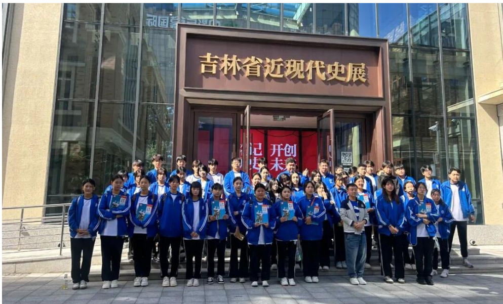
图 4-2：走进北京大街西历史文化街区

“思”之有悟，“行”之有路。本次“行走的思政课堂”为同学们搭建了“触摸历史、感悟精神”的实践平台，不仅让课本中的思政知识变得可感可触，更让同学们直观地感受到长春这座城市发展中的多民族交融历程。