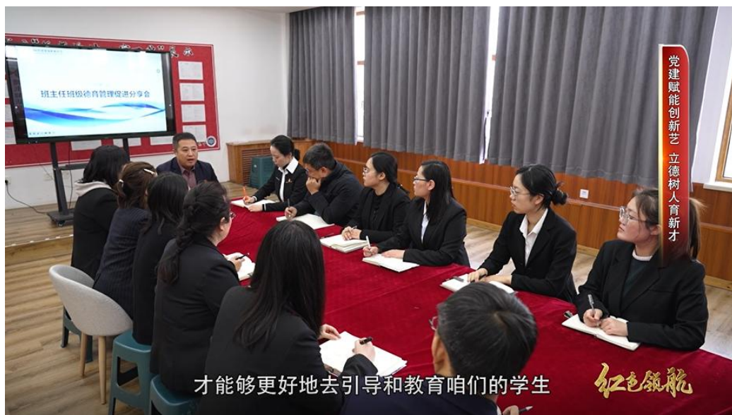
图 7-1：我身边的先锋党员优秀事迹展播