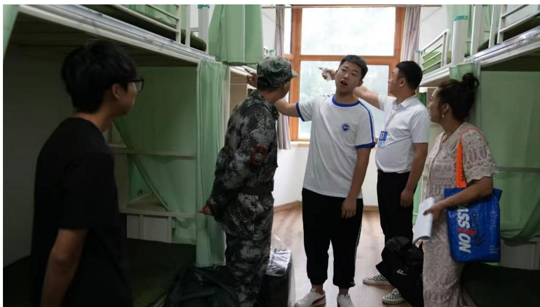
图 1-5：2025 年新生开学寝室照片