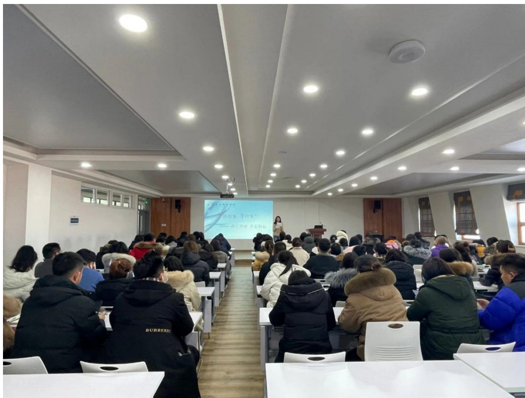
图 6-3：“践行师德、不忘初心”师德师风主题活动！

教育事业，增强责任感、使命感。以优秀的师德师风建设促进优秀的校风、教风、学风的形成，践行在乐学中会学、善学；在成功中成人、成事”的教育理念，长春国贸教务科于2023年12月29日，组织开展了“新形象 莘印象”师德师风主题活动。