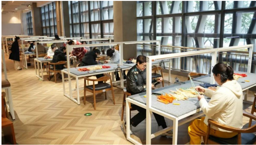
图 6-2：非遗传承手工编织项目