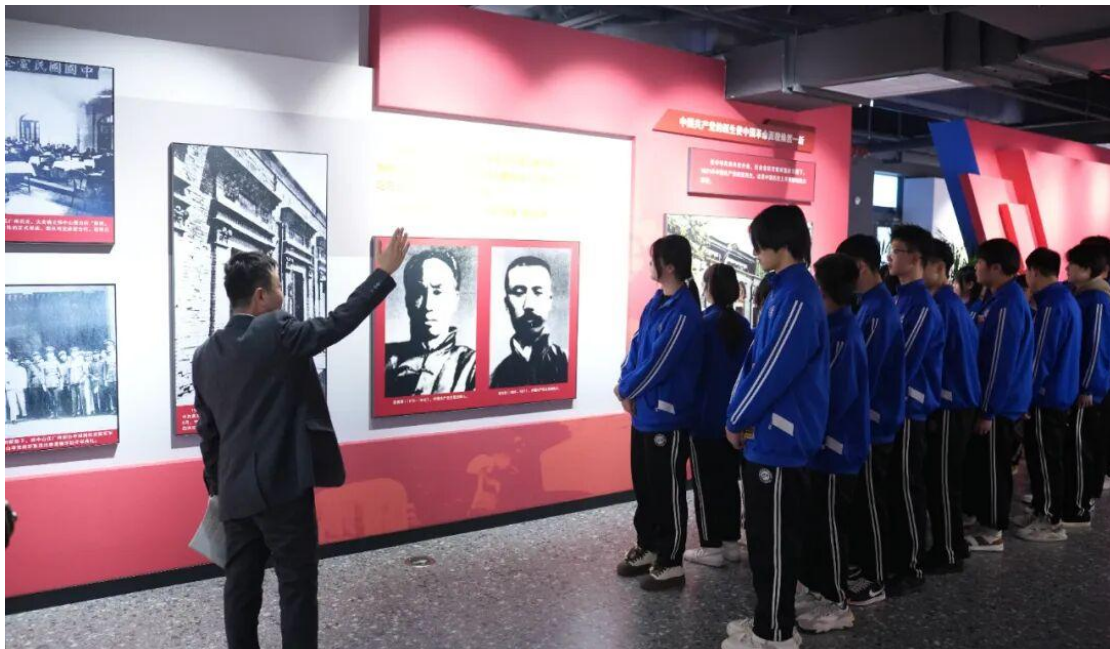
图 4-1：中国新型政党制度学习实践基地

此次走进中国新型政党制度学习实践基地的实践活动，是我校思政教育创新的一次成功尝试。未来，学校将继续搭建更多优质实践平台，引领同学们立足专业、勤学苦练，把社会主义核心价值观内化于心、外化于行，以青春之我、奋斗之我，为国家发展、社会进步贡献国贸学子的青春力量！