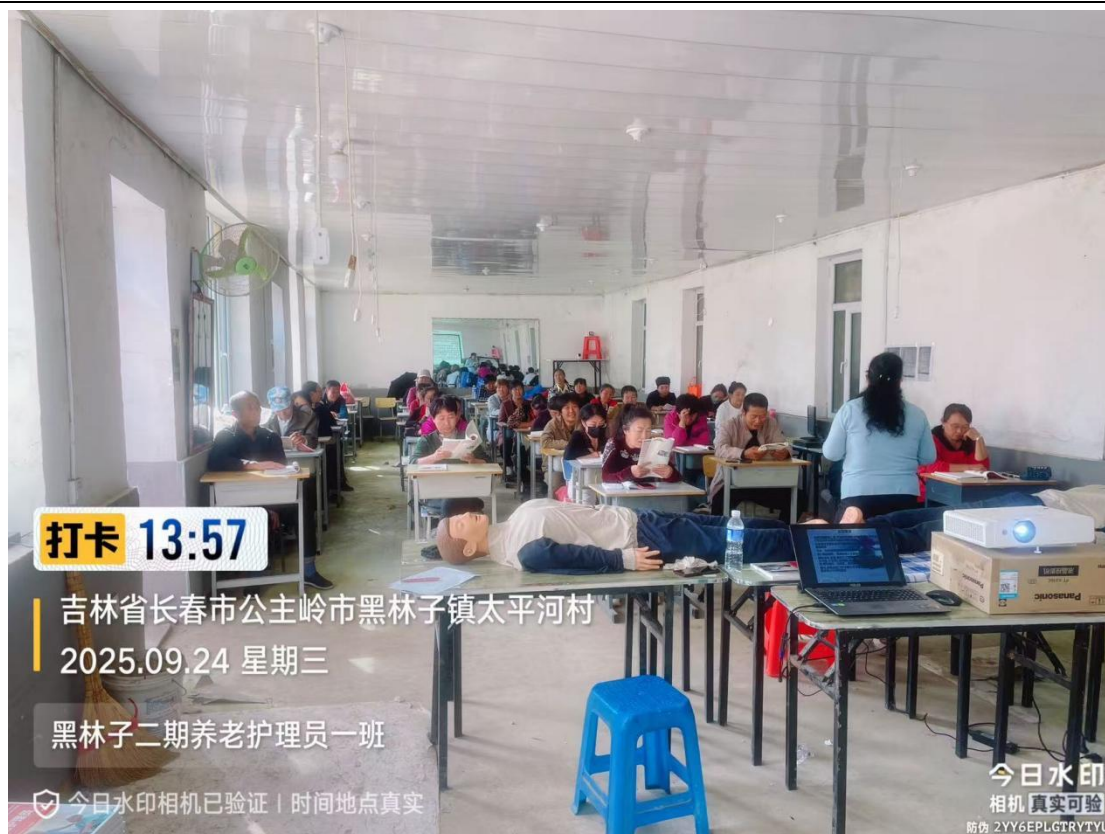
图 3-1： “养老护理员”职业技能培训