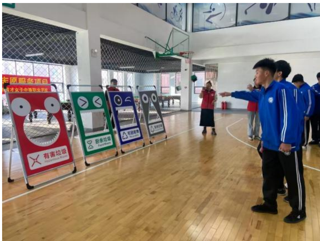
图3-4：学生认识垃圾分类