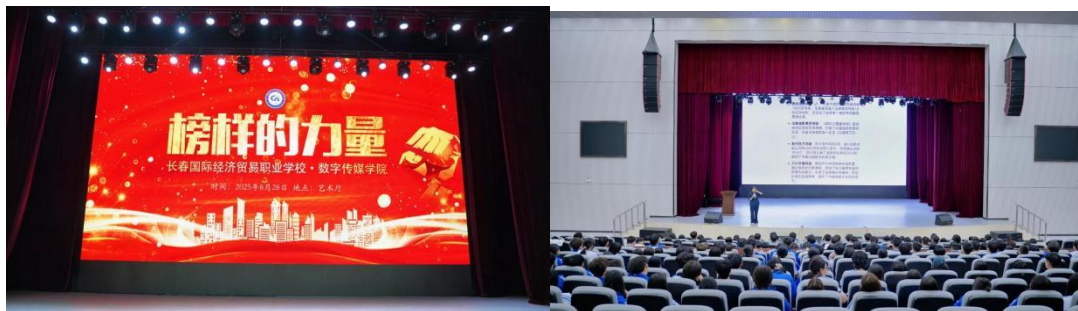
图 1-2 ： 开学第一课-榜样的力量

元化，通过校内参观、新生讲座、团队辅导、主题班会、新老生座谈会、开学第一课、校内文艺（知识）竞赛、新生现场演练等多种教育教学方式，为入25级新生开展主题清晰、内容丰富、形式多样的入学教育活动。