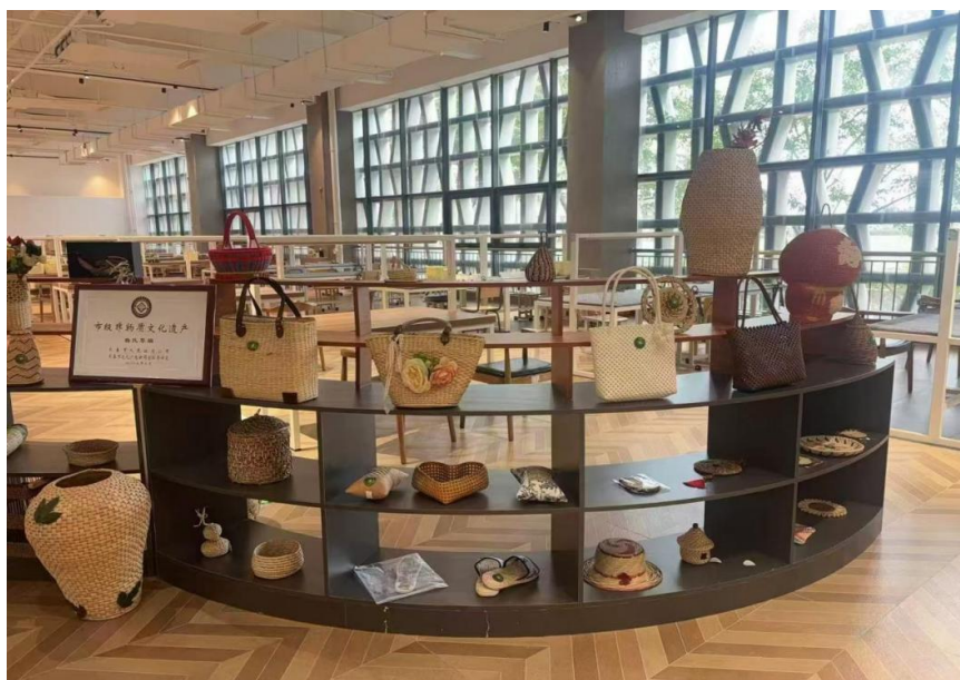
图 4-8：非遗草编大师工作室