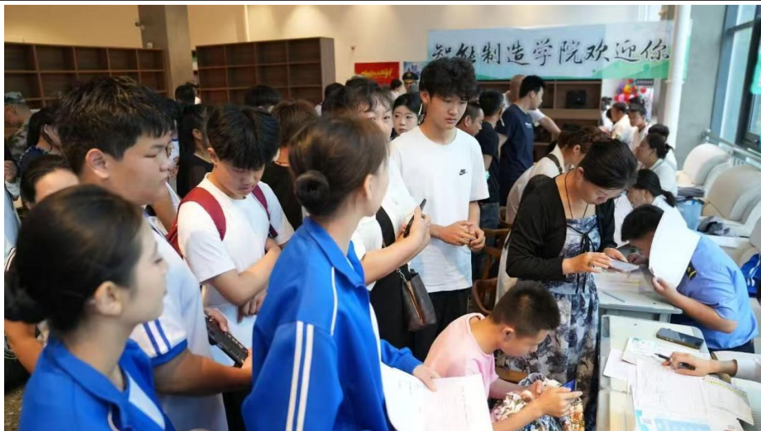
图 1-4：2025 年 秋季新生报道现场