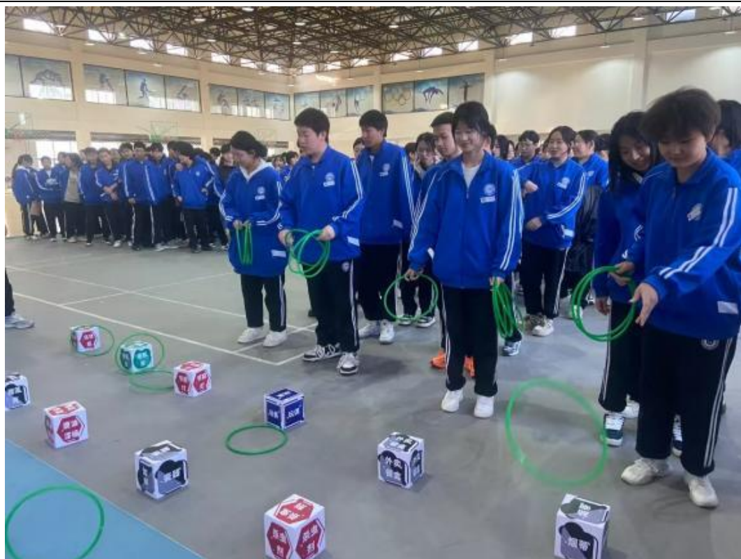
图 3-3：“垃圾分类我先行、文明实践树新风”活动