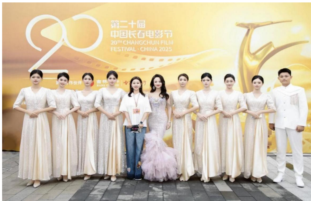
图 2-3：第二十届中国长春电影节开幕式

推动专业课实践教学、思政课程实践、社会实践活动、创新创业教育与志愿服务有机融合，不断完善实践育人规章制度，系统推进实践育人各项工作，构建起实践育人统筹引领、贯穿人才培养全过程的工作格局。