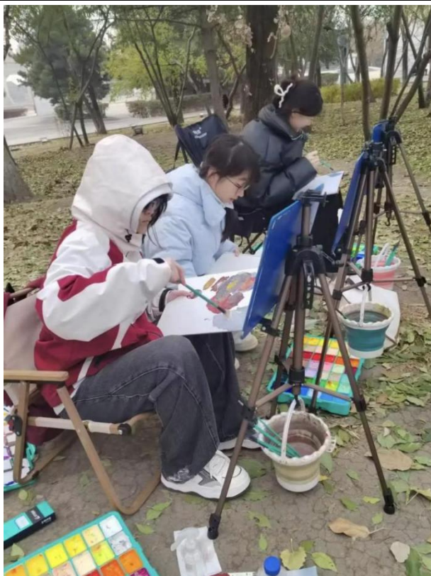
图 4-7：国贸学校学生美术写生