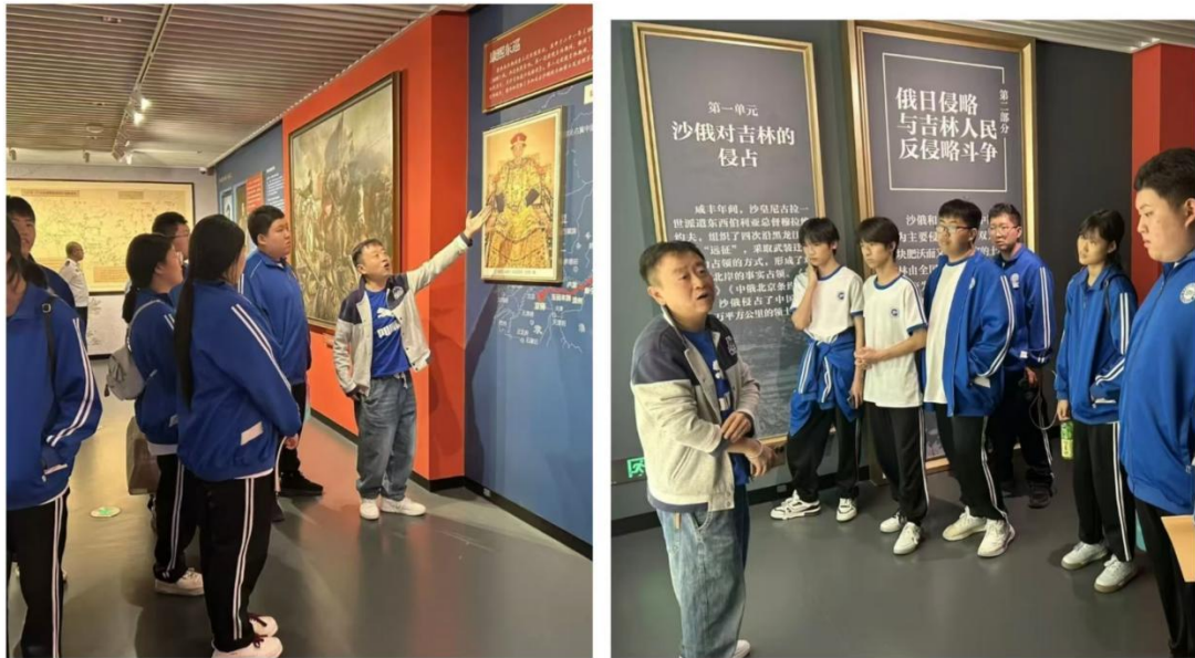
图2-1：吉林省近现代史展览馆研学

业素养、社会服务深度融合，引导学生在实践中淬炼品格、精进技能，切实筑牢成长成才根基。