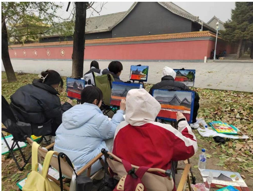
图4-6：学生户外写生特色实践课

点缀画面的生动元素。同学们弯腰调色、挥笔作画，专注的神情里满是对艺术创作的热忱，他们不仅精准把握了冷暖色调的光影变化，更灵活运用造型抽象技巧，将真实场景转化为富有感染力的画作，展现出国贸学子极强的艺术领悟力与创造力。